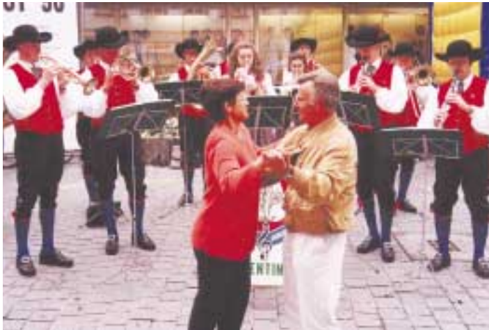
Spontanes Tanzvergnügen auf dem Altstadtpflaster.