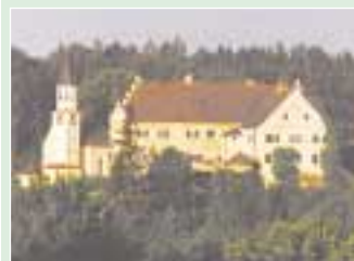
Schloss Hexenagger im Naturpark Altmühltal

Theatertage 9.-11.8.99 Unter Kennern ein absoluter Geheimtip. Szenerien mit wechselnden und wandern- den Bühnen auf dem Schlossareal: Shakespeares "Sommernachtstraum" und "Der Glöckner von Notre Dame" stehen diesmal auf dem Programm.