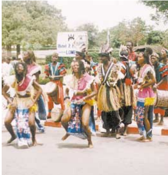
Afrikanische Tanzgruppe Balafon aus Togo