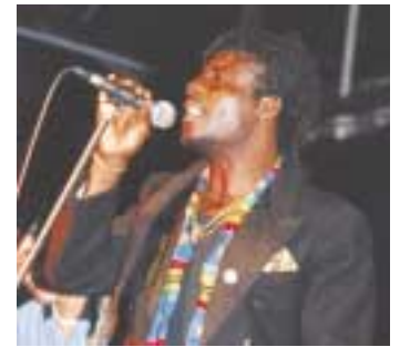
ROOT B TAMA