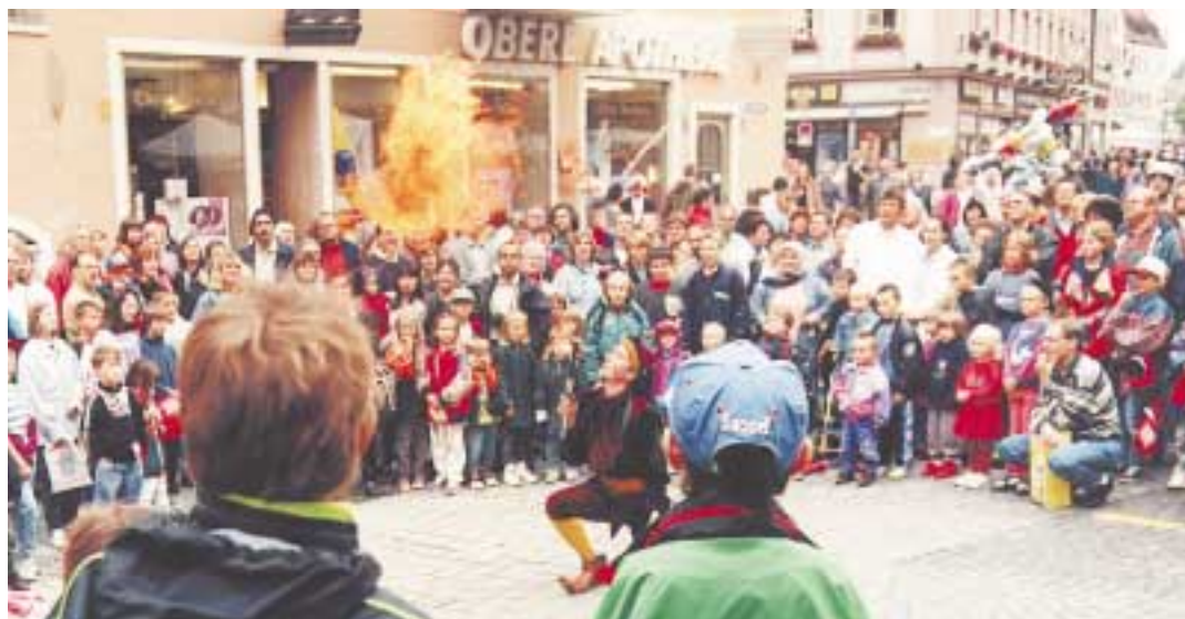
Die Straßen und Plätze der Altstadt werden wieder zum Tummelplatz für Bürgerfestbesucher und Akteure.

Das 14. Ingolstädter Bürgerfest geht heuer am 2. und 3. Juli über die Bühnen der historischen Altstadt. Auch diesmal geben sich unter Federführung des Kulturamtes hunderte von Akteuren ein Stelldichein um die Straßen und Plätze mit ihren Darbietungen und besonderem Flair zu verzaubern. Wie schon in den Jahren zuvor kann mit 200.000 Besuchern gerechnet werden - falls das Wetter mitspielt. Rundum gesehen, bietet das