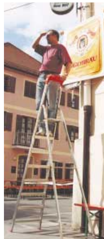
Wie wird das Bürgerfestwetter?

anstaltungsreihe "Blick nach Westafrika" gesetzt. Die Ingolstädter Verkehrsgesellschaft bietet der Bevölkerung wieder einen besonderen Service mit dem Bürgerfestfahrplan, der bis weit nach Mitternacht auf allen Linien erweitert wird. Die Haltestellen Harderstraße und Rathausplatz werden nicht bedient - die Haltestellen für alle Linien werden in der Tränktorstraße eingerichtet. Schon traditionell sind die