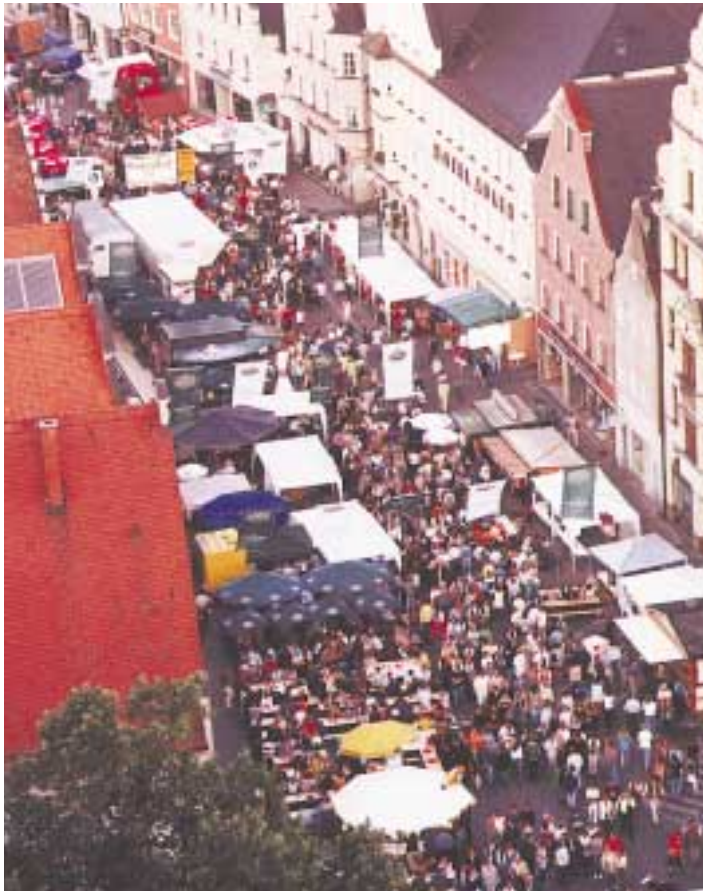
Blick vom Münster auf das Bürgerfestreiben.