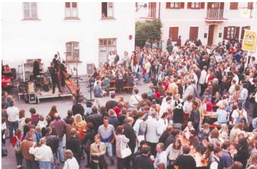
Die Straßen und Plätze in der Ingolstädter Altstadt werden wieder zu einzigartigen Veranstaltungsbühnen - wie hier vor der Neuen Welt in der Griesbadgasse.