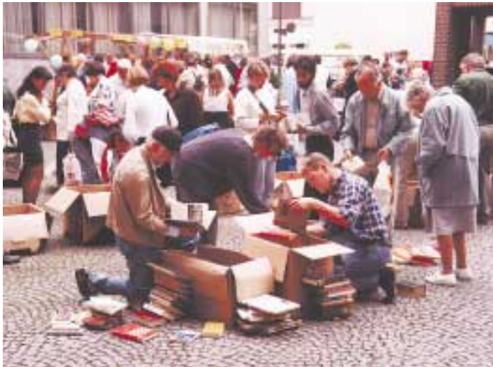
„Bücher kiloweise“ im Innenhof der Sparkasse.